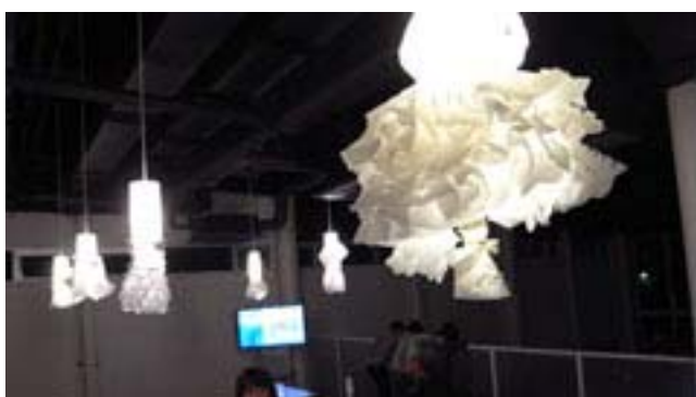
図6) ワールド産学共同プロジェクト（担当教員：瀬能 見明 田頭 久富）学生作品 Paper Dress