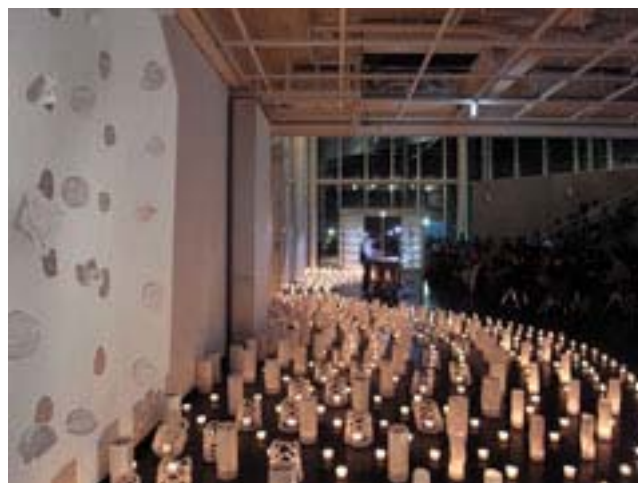
図9) 左側壁面展示 基礎分野科目「デザイン基礎特別演習 B（担当教員：中山 久富）」学生作品 BONE