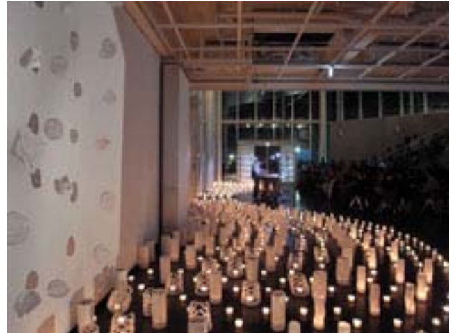
図9) 左側壁面展示 基礎分野科目「デザイン基礎特別演習 B（担当教員：中山 久富）」学生作品 BONE