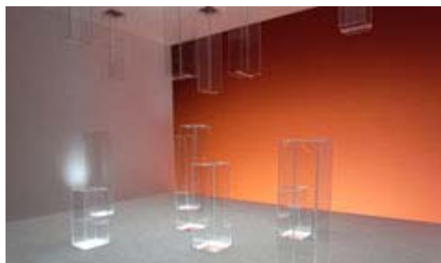
図4) 環境・建築デザイン学科 藤山ゼミ学生作品 Pulling Light 引出す照明