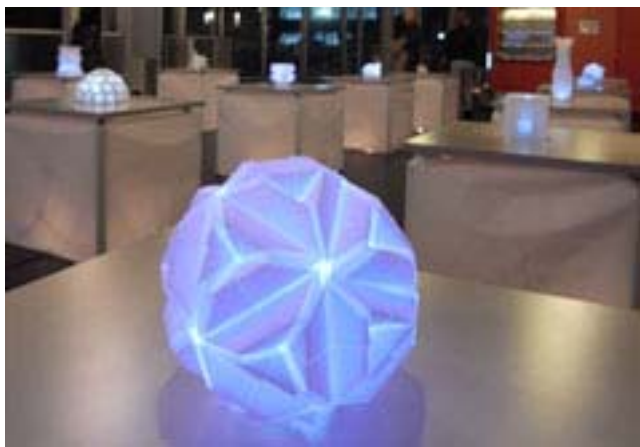
図5) プロダクトデザイン学科「プロダクト基礎実習Ⅱ（担当教員：見明 田頭）」学生作品 LED Lamp Shade