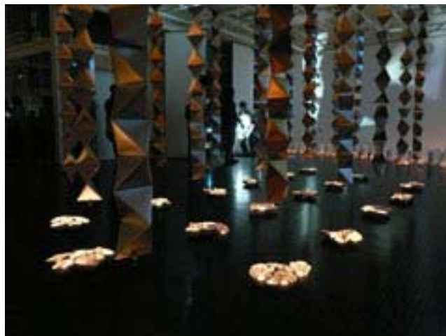
図2) ビジュアルデザイン学科 荒木ゼミ学生作品 two dozen luminous columns - 2ダースの光柱 -