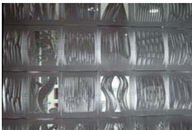
図12) 名倉誠人演奏曲「Triple Jump (Hop Skip Jump)」を聴き、楽譜を読み込むことから発想された学生作品 Modeling the score