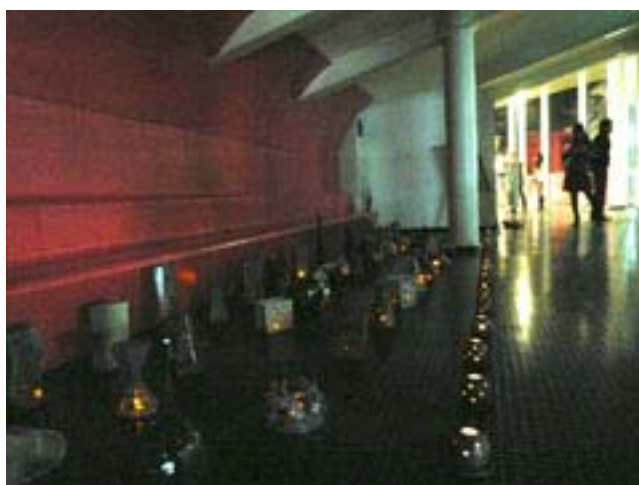
図1) クラフト・美術学科「素材と加工法（担当教員：市野）」

2010年12月21日に第3回「構成された光展」を開催した。第2回で実施したプログラムに加えて、複数の専門学科の授業とゼミ、産学協同プロジェクトの作品が展示された。（図1～図10）