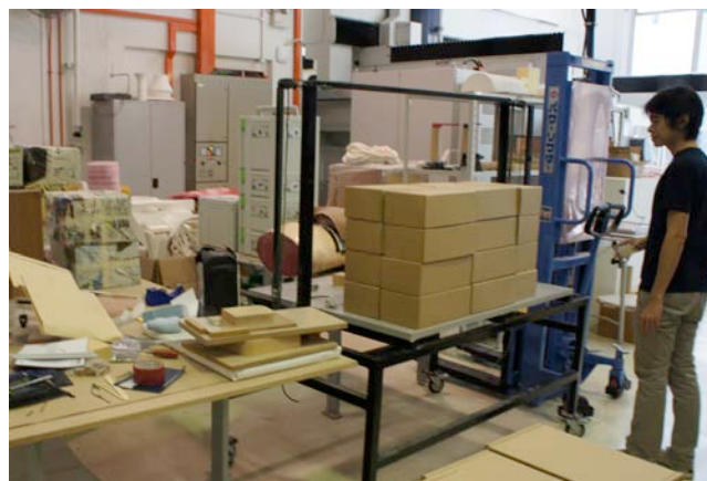
写真3) 工房内で梱包され、出荷を待つD.Labの商品

大学教員が現役のデザイナーである場合やデザインが評価された学生作品が商品化される場合のほか、大学と企業の産学連携によって教員や学生の作品が商品化される事例は見られるが、大学が独自のブランド名で商品を開発、生産、さらには販売している例は、管見の限り、他には見