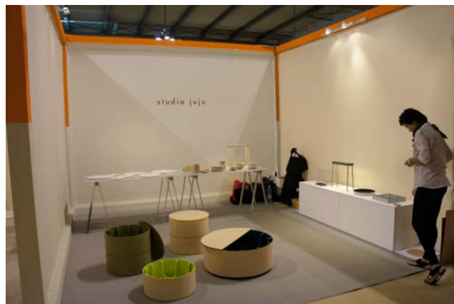
写真7) 2011年のサローネ・サテリテでの studio juju の展示