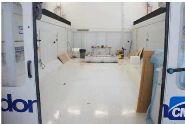
写真4) シンガポール国立大学で導入されている、5軸NCルーター。3500mm×7500mm×高さ2200mmまでの範囲を、±0.2mmの誤差で加工することができる。

大学内の工房での生産と言うと、簡素な加工や手作業での生産を想像するが、シンガポール国立大学は、実寸の車のモデルを削り出す事ができるほど巨大なガントリー型の5軸NCルーター、3Dプリンタ、レーザー加工機など、数多くの先進的な工作機械を導入しており、商品を量産するのに十分な生産設備を有している（写真4）（写真5）。