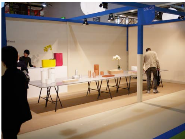
写真6) ミラノサローネ本会場内で開催される、若手デザイナーの作品展サローネ・サテリテ 2010 における D.Lab の展示

日本国内と海外の展示会とが大きく異なる点は、若手への注目度である。日本ではいまだに名の知られたデザイナーの作品が偏重され、無名の若手デザイナーの作品は雑誌等でも取り上げられることは少ないが、海外ではデザイナーのネームバリューに関わらず、商品そのものが注目され、評価され得るということである。特にミラノサローネは「サローネ・サテリテ」という若手専門のブースが設けられるなど、「新しい才能」の発見に力が注がれている。このような場に打って出ることは、ブランドの認知度の向上を図る上で、非常に重要な機会である。