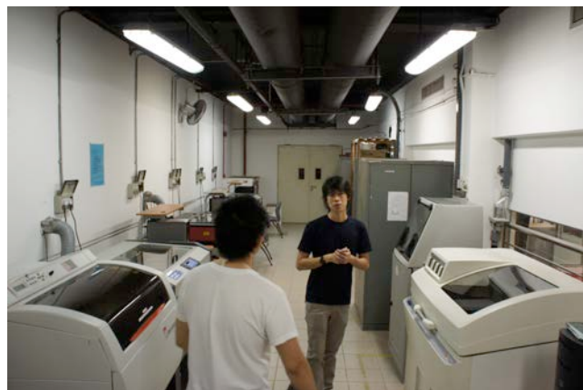
写真5) 工房の一角に立ち並ぶ、レーザー加工機や3Dプリンタ。

シンガポール国立大学がこのような体制でデザインを発信している理由として、産学連携事業に積極的な企業であっても、ワークショップの開催やコンペティションの実施、あるいは共同のプロジェクトの成果物としてのプロトタイプ制作は比較的容易に行ってくれるが、量産される商品の開発となると手を出したくないという事情がある。デザイナーにとって作品が商品化されるということは、大