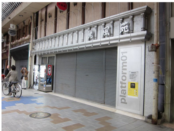
図6 混浴温泉世界 「platform 01」