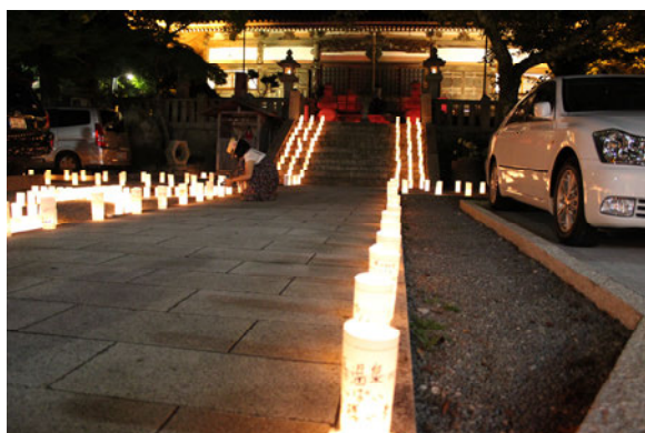
図4 有馬温泉ゆけむり大学「ねがいの灯り LOVE&PEACE」