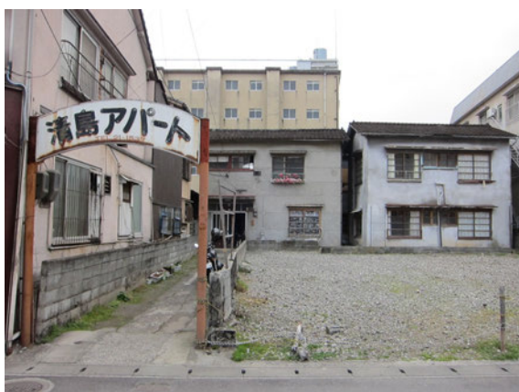
図7 混浴温泉世界 「清島アパート」

「由布院温泉」及び「黒川温泉」の調査では、双方の温泉地も活性化、観光客獲得のアイデアを地元住民主導で独自に展開し、継続した結果が全国的に知名度の高い温泉観光地となった経緯であることが確認出来た。