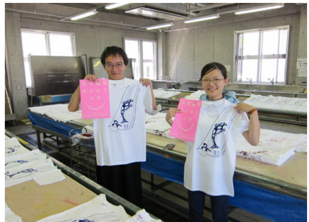
図3 有馬温泉ゆけむり大学「Tシャツ」

ファッションデザインの実践では、前出大学の制服としてTシャツを採用し、ファッションデザイン学科学生たちが、デザイン及び本学のスタジオにてプリント作業を行った。（図3）