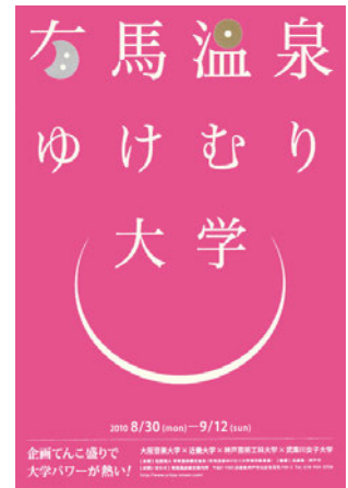
図2 有馬温泉ゆけむり大学「校章」・「チラシ」 開学式 演台前「ポスター」

ファッションデザインの実践では、前出大学の制服としてTシャツを採用し、ファッションデザイン学科学生たちが、デザイン及び本学のスタジオにてプリント作業を行った。（図3）