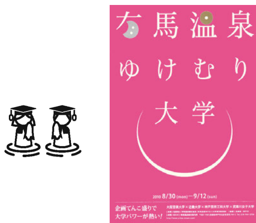
図2 有馬温泉ゆけむり大学「校章」・「チラシ」 開学式 演台前「ポスター」

ファッションデザインの実践では、前出大学の制服としてTシャツを採用し、ファッションデザイン学科学生たちが、デザイン及び本学のスタジオにてプリント作業を行った。（図3）