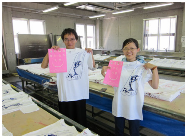
図3 有馬温泉ゆけむり大学「Tシャツ」

ファッションデザインの実践では、前出大学の制服としてTシャツを採用し、ファッションデザイン学科学生たちが、デザイン及び本学のスタジオにてプリント作業を行った。（図3）