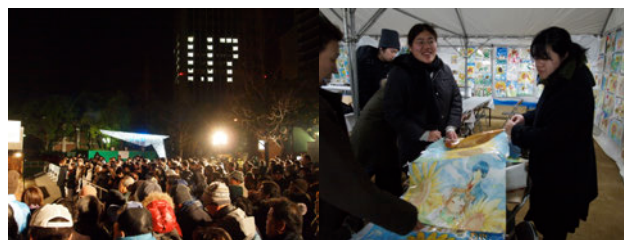
図 14) 「1.17 のつどい」

私たちは、前日16日に会場で竹筒並べを手伝ったあと、深夜から17日にかけて交流テント内に待機していた。そのため、訪れる多くの方々と対話し、震災に対するさまざまな思いを聞くことができた。