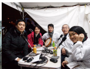
図 13) ラジオの生中継