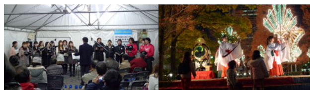
図 10) 特設テントでの合唱 図 11) 「希望の灯り」周辺での雅楽

また、各回の合間に、学生が震災についての感想文を朗読するといった交流も図られた。