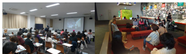
図1) 第1回震災セミナー 図2) 人と防災未来センター見学