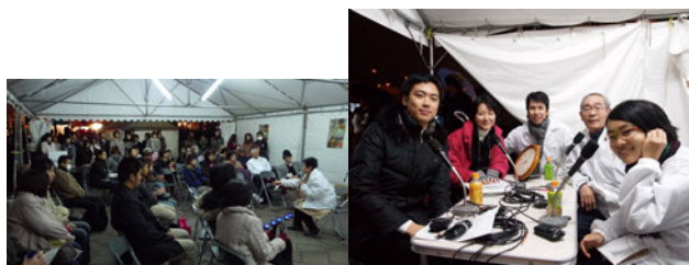
図 12) 語り部の会

このプロジェクトは、新聞やテレビ、ラジオなど多くのマスコミに『ルミナリエの原点回帰』として取り上げられ、日ごとに観客が増え、多くの反響が寄せられた。