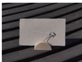
図 5) LED とメッセージカード