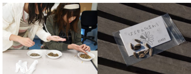
図 6) 種の仕分 図 7) 配布した種とメッセージカード

育てた花から種を収穫し、6~8 粒ずつメッセージカードとともに袋詰めし、「記憶」のモニュメントの参加者に、無料配布した。命を育て未来につなげる本プロジェクトは、命の尊さや人の絆の大切さを考える上で、非常に実のある体験となった。